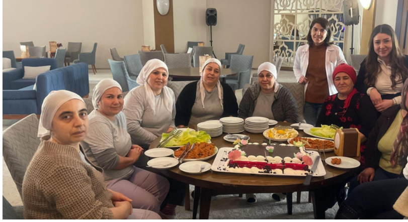
8 Mart Dünya Kadınlar Günü Personel Etkinliği

Birçok sosyal sorumluluk projemize aksamadan devam ediyoruz.